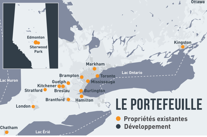
LE PORTEFEUILLE ● Propriétés existantes ● Développement